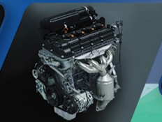
EFFICIENT K12M ENGINE

Mesin yang efisien dapat diandalkan untuk setiap perjalanan