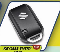
KEYLESS ENTRY (GX) NEW

Praktis dan dinamis dengan Push Start Stop Button