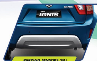
PARKING SENSORS (GL)

Tampilan NEW IGNIS yang unik, sporty, dan stylish semakin terlihat dengan tambahan bermacam aksesoris yang menambah nilai gaya hidup urban.