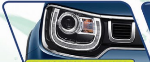
LED PROJECTOR HEADLAMPS WITH DRL (GX)

Desain baru yang dinamis untuk tampilan makin stylish