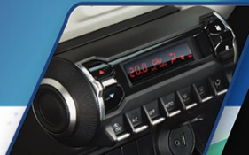
AUTO CLIMATE A/C WITH HEATER (GX)

NEW IGNIS sebagai generasi baru URBAN SUV, hadirkan fitur-fitur berkelas. Mendukung mobilitas perkotaan yang dinamis baik dari sisi kenyamanan, keamanan, dan juga power.