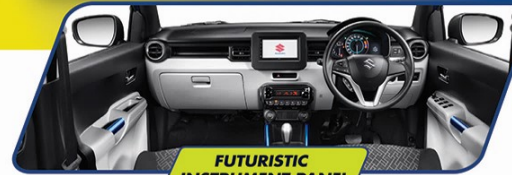
FUTURISTIC INSTRUMENT PANEL