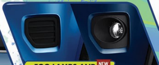
FOG LAMPS AND BEZEL DESIGN (GX&GL) NEW

Headlamps yang tegas dengan cahaya yang terang, aman untuk berkendara