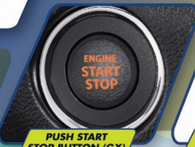
PUSH START STOP BUTTON (GX)

Mesin yang efisien dapat diandalkan untuk setiap perjalanan