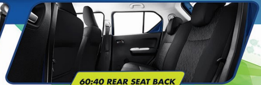
60:40 REAR SEAT BACK