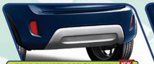
REAR BUMPER DESIGN, WITH REAR REFLECTOR AND DIFFUSER NEW

Desain baru untuk tampilan semakin elegan