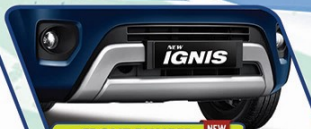
FRONT BUMPER DESIGN WITH DIFFUSER NEW

Tampilan baru bagian belakang kini semakin dinamis