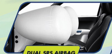
DUAL SRS AIRBAG

Melalui berbagai teknologi keamanan terkini, NEW IGNIS berikan ketenangan serta kenyamanan saat berkendara.